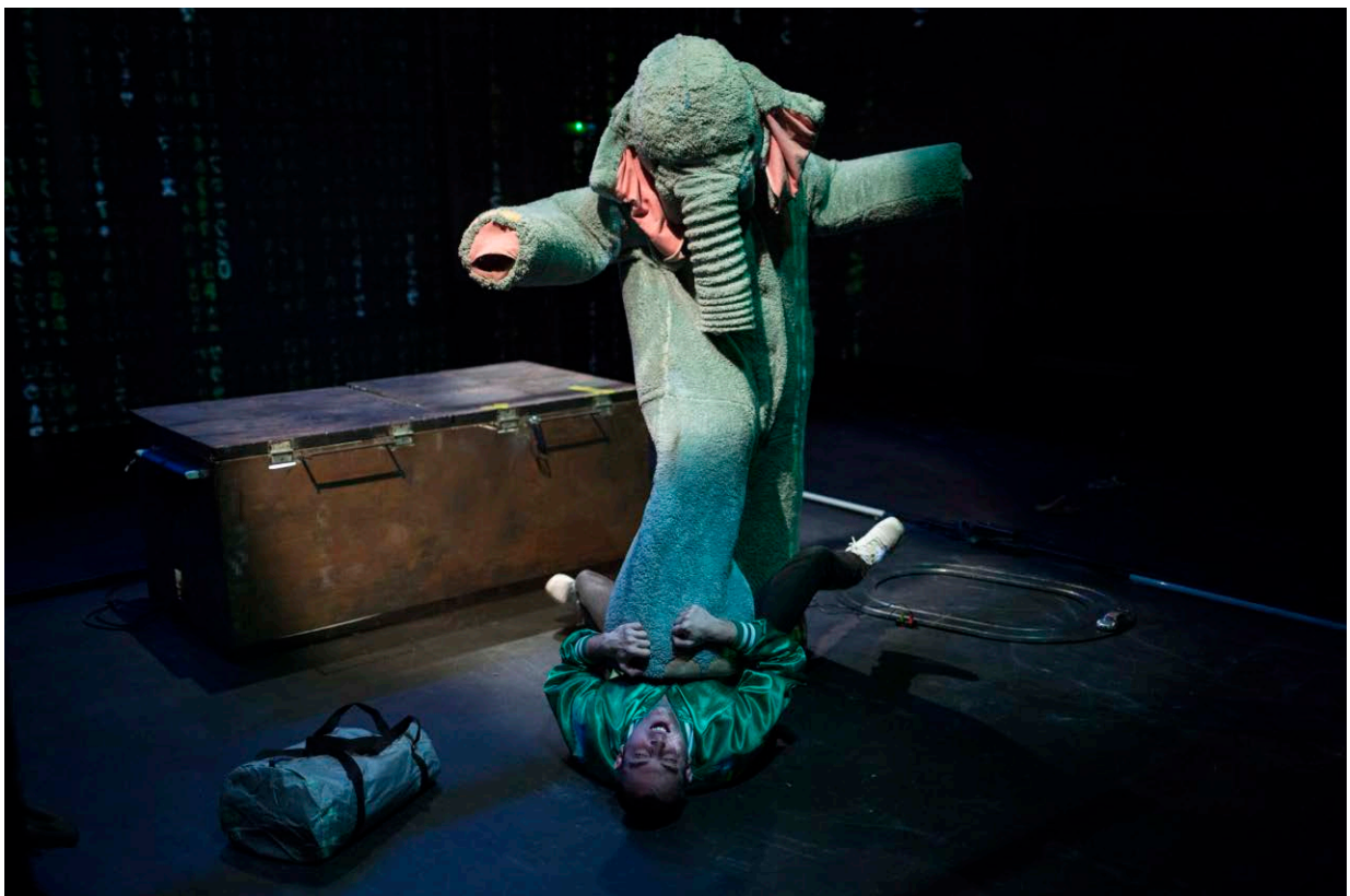
Elefant Terrible d'Eric Balbàs i Roger Torns a la Sala Beckett.